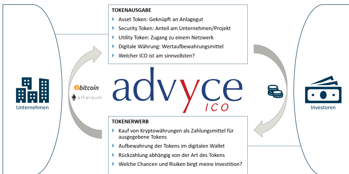
Abbildung 1: Funktionsweise eines ICOs

welche sich in ihrer Ausfertigung unterscheiden können. Investoren des ICO-Projekts erwerben die angebotenen Tokens gegen die Zahlung einer vorher festgelegten (Krypto-) Währung und hoffen auf die zukünftige Wertsteigerung der Tokens an dem jeweiligen Handelsplatz.