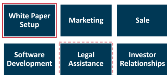
Abbildung 3: ADVYCE ICO-Services

Die Initiierung erfolgreicher ICO-Projekte erfordert ein Team starker Partner an seiner Seite.