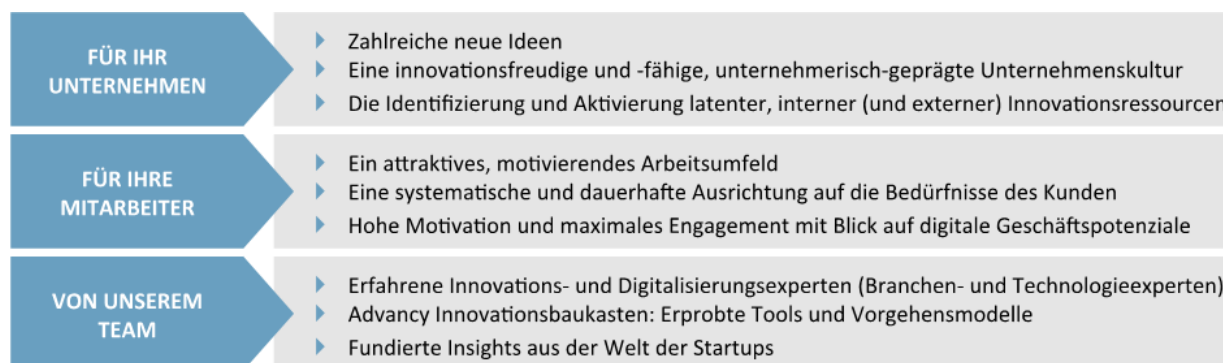
Abbildung 2: Advyce - Ihre Unternehmensberatung die Sie auf dem Weg zur digitalen Innovation unterstützt; Quelle: Advyce.

In der nachfolgenden Abbildung haben wir Ihnen unsere Vorteile für Ihr Unternehmen und Ihre Mitarbeiter dargestellt: